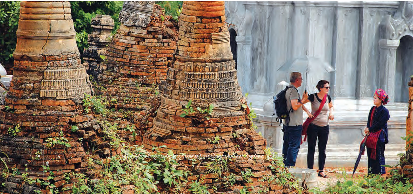
မြန်မာနိုင်ငံခရီးသွားလုပ်ငန်းတွင်လူမှုအဖွဲ့အစည်းများပါဝင်ဆောင်ရွက်ရေး ဝေါ်ခ

ပါဝင်ဆောင်ရွက်ရန်ပုဂ္ဂိုလ်များ - ဟိုတယ်နှင့်ခရီးသွားလာရေးလုပ်ငန်း ဝန်ကြီးဌာန(ဗဟိုပြုဌာန)၊ သမဝါယမဝန်ကြီးဌာန၊ ပညာရေးဝန်ကြီးဌာန၊ ယဉ်ကျေးမှုဝန်ကြီးဌာန၊ လူမှုဝန်ထမ်း၊ ကယ်ဆယ်ရေးနှင့် ပြန်လည်နေရာချထားရေးဝန်ကြီးဌာန၊ ဖွံ့ဖြိုးတိုးတက်ရေးအဖွဲ့အစည်းများ၊ အစိုးရမဟုတ်သောအဖွဲ့အစည်းများ၊ အသေးစားနှင့် အလတ်စား လုပ်ငန်းများ ဗဟိုဌာန။