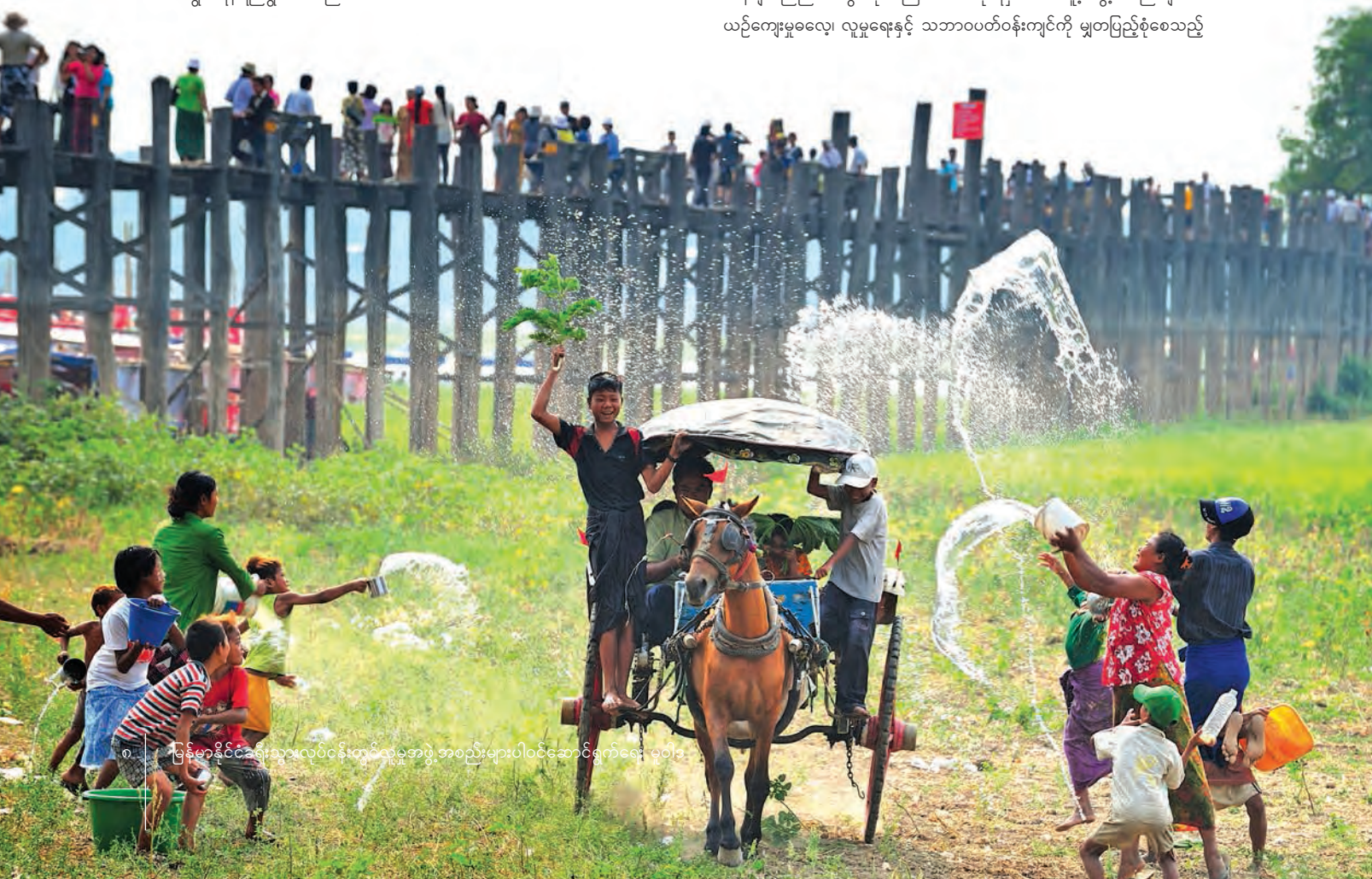
မြန်မာနိုင်ငံခရီးသွားလုပ်ငန်းတွင်လူမှုအဖွဲ့အစည်းများပါဝင်ဆောင်ရွက်ရေး မူဝါဒ

“ခရီးသွားလုပ်ငန်းသည် မြန်မာနိုင်ငံ၏ အရေးကြီးဆုံးသောကဏ္ဍများအနက် တစ်ခုဖြစ်ပြီး၊ စနစ်တကျစီမံခန့်ခွဲလျှင် ကြီးမားသောစွမ်းဆောင်ရည်နှင့်အတူ ထူးကဲသော စီးပွားရေးအခွင့်အလမ်းများရရှိစေရန် လူမှုရေးနှင့်စီးပွားရေးဖွံ့ဖြိုးမှုကို ဟန်ချက်ညီညီ ပေးစွမ်းနိုင်ကြောင်း၊ အစိုးရမှဒေသခံလူမှုအဖွဲ့အစည်းများ၏ ယဉ်ကျေးမှုဓလေ့၊ လူမှုရေးနှင့် သဘာဝပတ်ဝန်းကျင်ကို မျှတပြည့်စုံစေသည့်