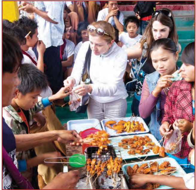
ဒေသခံလူမှု အဖွဲ့အစည်းများပါဝင်နိုင်အောင် အားပေးမြှင့်တင်ပေးရမည်ဖြစ်သည်။

(ဃ) ဟိုတယ်နှင့် ခရီးသွားလာရေးလုပ်ငန်းဝန်ကြီးဌာနသည် အကောင်အထည်ဖော်ရာတွင် လိုအပ်သည့် သတင်းအချက် အလက်များ၊ အကြံဉာဏ်များ၊ အဆက်အသွယ်များပေးခြင်း၊ ခရီးသွားလုပ်ငန်းစီမံကိန်းအတွက် ဒေသဆိုင်ရာ စီမံအုပ်ချုပ်မှု အထောက်အကူများ ပေးခြင်းတို့ဖြင့် ကူညီသွားရမည်ဖြစ်သည်။ ဝန်ကြီးဌာနသည် ခရီးသွားလုပ်ငန်းအား ထိန်းကြောင်းရေးနှင့် ဇုန်များဖွံ့ဖြိုးရေး စီမံကိန်းရေးဆွဲ၍ ထူထောင်ရာတွင်